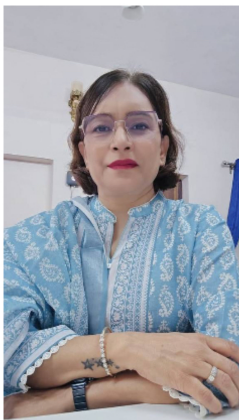
ਸਮਾਂ ਹਮੇਸ਼ਾ ਆਪਣੀ ਚਾਲ ਚੱਲਦਾ ਰਹਿੰਦਾ

ਹੈ। ਸਮੇਂ ਨਾਲ ਹਰ ਚੀਜ਼ ਨੇ ਬਦਲਣਾ ਹੁੰਦਾ ਹੈ। ਜਨਮ ਤੋਂ ਬਚਪਨ, ਬਚਪਨ ਤੋਂ ਜਵਾਨੀ ਤੇ ਜਵਾਨੀ ਤੋਂ ਬੁਢਾਪਾ ਅਖੀਰ ਮੌਤ ਤੇ ਜਾ ਕੇ ਕਹਾਣੀ ਮੁੱਕਦੀ ਹੈ। ਇਸ ਵਿੱਚ ਹਰ ਅਵਸਥਾ ਦਾ ਆਪਣਾ ਇੱਕ ਮੁਕਾਮ ਹੈ। ਜਿੰਦਗੀ ਵਿੱਚ ਹਰ ਉਮਰ ਦਾ ਹਰ ਸਮੇਂ ਦਾ ਆਪਣਾ ਇਕ ਰੰਗ ਹੈ। ਸਮੱਸਿਆ ਉਦੋਂ ਆਉਂਦੀ ਹੈ ਜਦੋਂ ਅਸੀਂ ਆਪਣੀ ਢਲਦੀ ਜਵਾਨੀ ਨੂੰ ਮਨਜ਼ੂਰ ਨਹੀਂ ਕਰ ਪਾਉਂਦੇ। ਸਾਨੂੰ ਔਖਾ ਲੱਗਦਾ ਹੈ ਇਸ ਗੱਲ ਨੂੰ ਮੰਨਣਾ ਕਿਉਂ ਸਾਡੀ ਉਮਰ ਢਲ ਰਹੀ ਹੈ ਤੇ ਇਸ ਨਾਲ ਬਹੁਤ ਕੁਝ ਬਦਲ ਵੀ ਰਿਹਾ ਹੈ। ਢਲਦੀ ਉਮਰ ਨਾਲ ਸਿਰਫ ਵਾਲ ਚਿੱਟੇ ਨਹੀਂ ਹੁੰਦੇ ਜਾਂ ਸਿਰਫ ਝੁਰਝੀਆਂ ਚਿਹਰੇ ਤੇ ਬੋੜਾ ਬੋੜਾ ਨਜ਼ਰ ਆਉਣੀਆਂ ਸ਼ੁਰੂ ਨਹੀਂ ਹੁੰਦੀਆਂ। ਇਸ ਨਾਲ ਇੱਕ ਸਮਝ ਵੀ ਆਉਂਦੀ ਹੈ। ਇਸ ਨਾਲ ਬੰਦਾ ਸਹਿਜ ਵੀ ਹੁੰਦਾ ਹੈ। ਸਮਾਂ ਜੇ ਸਿਖਾਉਂਦਾ ਹੈ ਉਹ ਕੋਈ