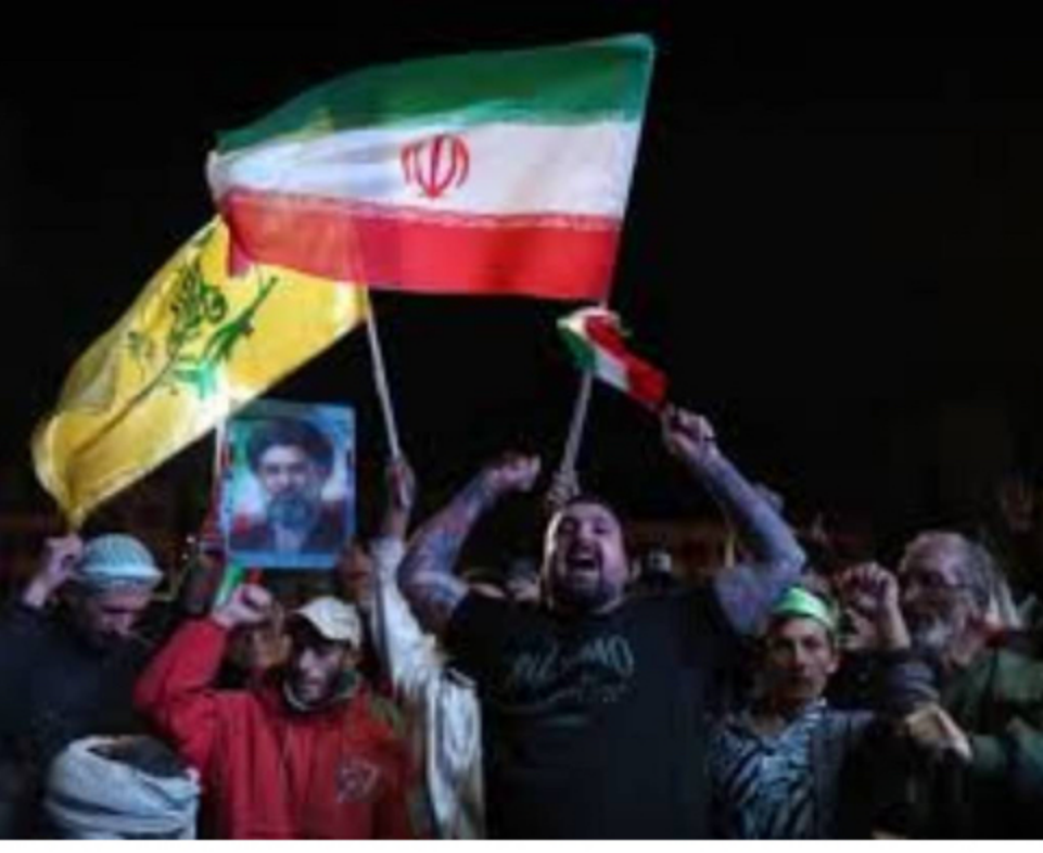
ਯੂਨਾਈਟਿਡ ਨੇਸ਼ਨਜ਼ ਅਤੇ ਹੋਰ ਸੰਸਥਾਵਾਂ ਤੋਂ ਵੀ ਇਸ ਬਾਰੇ ਜਾਂਚ ਦੀ ਮੰਗ ਉਠ ਰਹੀ ਹੈ।

ਇਸਲਾਮਾਬਾਦ ਇਸਲਾਮਾਬਾਦ ਵਿਚ ਚੱਲ ਰਹੀਆਂ ਇਰਾਨ ਅਤੇ ਅਮਰੀਕਾ ਵਿਚਾਲੇ ਜੰਗਬੰਦੀ ਗੱਲਬਾਤਾਂ ਦੇ ਵਿਚਾਲੇ ਇੱਕ ਤਸਵੀਰ ਨੇ ਪੂਰੀ ਦੁਨੀਆਂ ਨੂੰ ਸਦਮੇ ਵਿਚ ਪਾ ਦਿੱਤਾ ਹੈ। ਇਰਾਨੀ ਵਫ਼ਦ ਦੇ ਆਗੂ ਅਤੇ ਸਪੀਕਰ ਮੁਹੰਮਦ ਬਾਕਰ ਕਾਲੀਬਾਫ ਇੱਕ ਉਡਾਣ ਵਿਚ ਆਪਣੇ ਨਾਲ ਖੂਨ ਨਾਲ ਲੱਥਪੱਥ ਸਕੂਲੀ ਬੈਗ, ਛੋਟੇ ਬੱਚਿਆਂ ਦੇ ਚਿੱਤ੍ਰ, ਚਿੱਟੇ ਫੁੱਲ ਅਤੇ ਮੀਨਾਬ ਦੇ ਸ਼ਹੀਦ ਬੱਚਿਆਂ ਦੀਆਂ ਤਸਵੀਰਾਂ ਲੈ ਕੇ ਆਏ ਹਨ। ਇਸ ਤਸਵੀਰ ਨੂੰ ਦੇਖ ਕੇ ਹਰ ਕਿਸੇ ਦਾ ਦਿਲ ਰੋ ਉੱਠਿਆ ਹੈ। ਇਸ ਵਫ਼ਦ ਨੂੰ 'ਮੀਨਾਬ 168' ਦਾ ਨਾਮ ਦਿੱਤਾ ਗਿਆ ਹੈ, ਜੋ ਇਸ ਘਟਨਾ ਵਿਚ ਮਾਰੇ ਗਏ ਲਗਭਗ 168 ਬੱਚਿਆਂ ਨੂੰ ਯਾਦ ਕਰਦਾ ਹੈ।