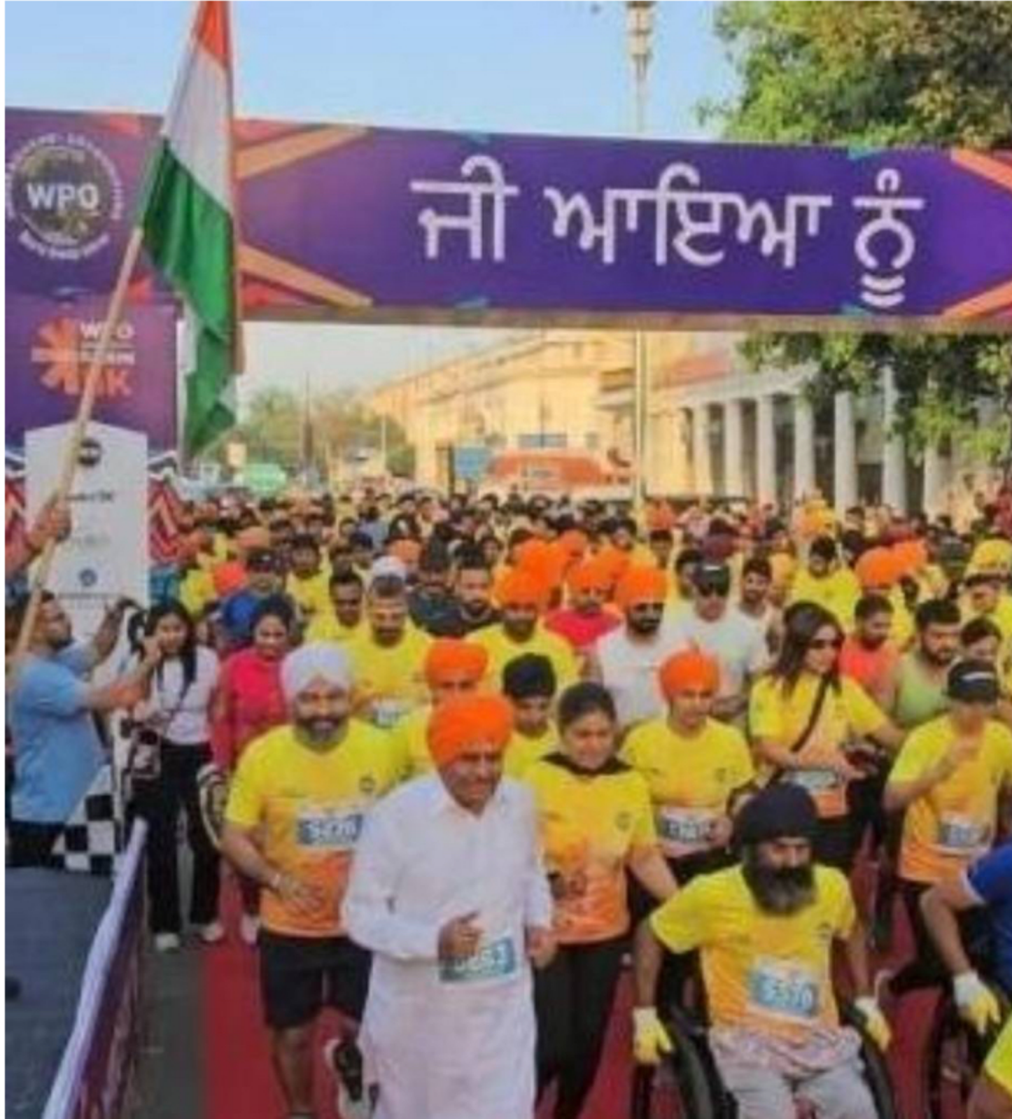
ਅੱਜ ਦੇ ਭੱਜਦੀ ਜੀਵਨ ਵਿਚ ਲੋਕਾਂ ਲਈ ਰੋਜ਼ਾਨਾ ਵਿਆਇਮ ਬਹੁਤ ਜ਼ਰੂਰੀ ਹੈ।