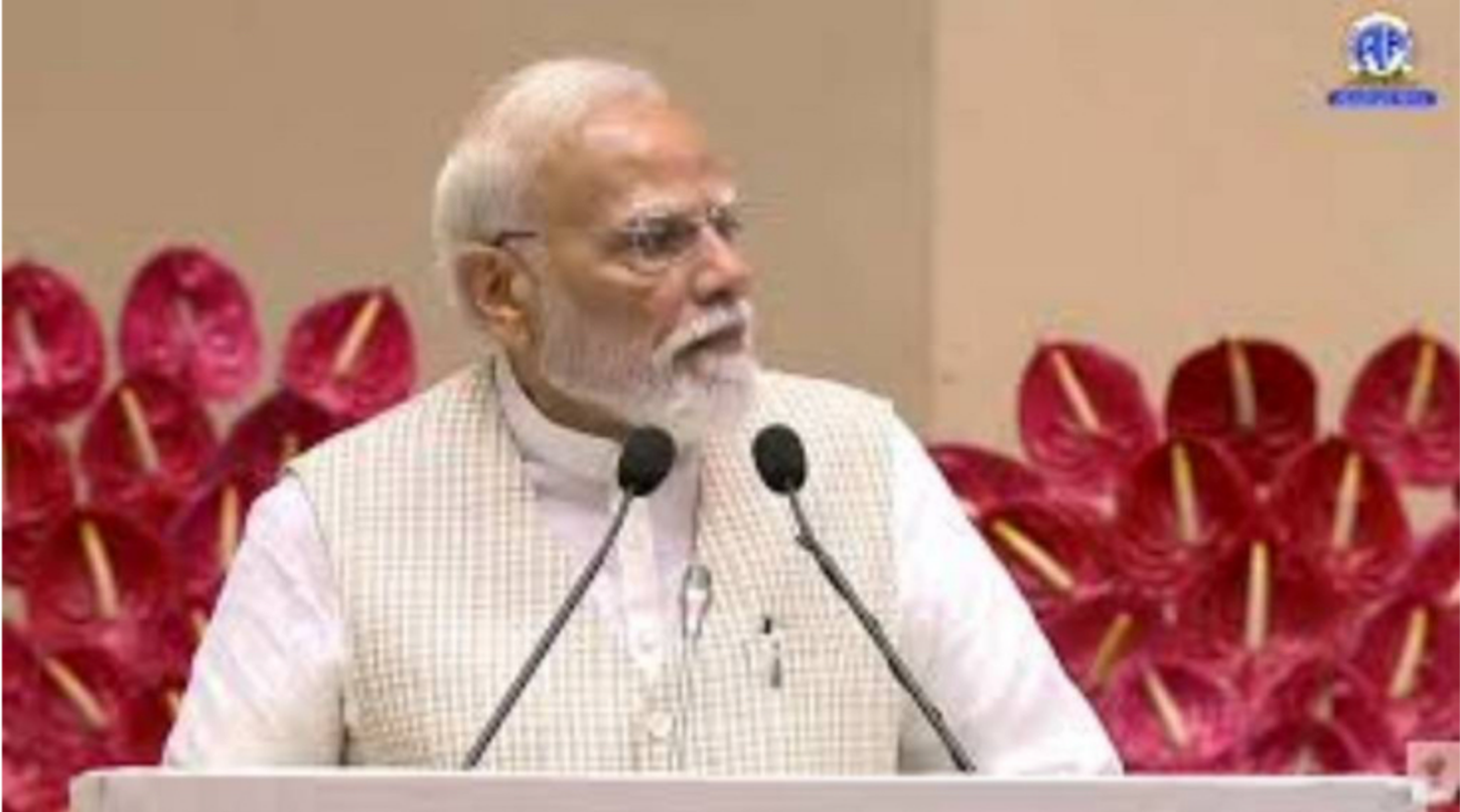
ਇਸ ਬਿੱਲ ਨਾਲ ਮਹਿਲਾ ਕੋਟਾ ਢਾਂਚੇ ਨੂੰ ਵਿਵਸਥਿਤ ਤਰੀਕੇ ਨਾਲ ਲਾਗੂ ਕਰਨ ਦੀ ਕੋਸ਼ਿਸ਼ ਕੀਤੀ ਜਾ ਰਹੀ ਹੈ।

ਨਵੀਂ ਦਿੱਲੀ, 16 ਅਪ੍ਰੈਲ ਪ੍ਰਧਾਨ ਮੰਤਰੀ ਨਰਿੰਦਰ ਮੋਦੀ ਨੇ ਵੀਰਵਾਰ ਨੂੰ ਲੋਕ ਸਭਾ ਵਿੱਚ ਇੱਕ ਮਹੱਤਵਪੂਰਨ ਭਾਸ਼ਣ ਦਿੰਦਿਆਂ ਸੰਵਿਧਾਨ (131ਵੀਂ ਸੋਧ) ਬਿੱਲ ਅਤੇ ਇਸ ਨਾਲ ਜੁੜੇ ਹੋਰ ਕਾਨੂੰਨਾਂ ਨੂੰ ਭਾਰਤੀ ਸੰਸਦੀ ਲੋਕਤੰਤਰ ਲਈ ਇੱਕ ਨਿਰਣਾਇਕ ਅਤੇ ਇਤਿਹਾਸਕ ਪਲ ਵਜੋਂ ਉਜਾਗਰ ਕੀਤਾ। ਉਨ੍ਹਾਂ ਨੇ ਸਾਰੀਆਂ ਰਾਜਨੀਤਿਕ ਪਾਰਟੀਆਂ ਨੂੰ ਰਾਜਨੀਤੀ ਤੋਂ ਉੱਪਰ ਉੱਠ ਕੇ ਇਸ ਮੌਕੇ ਨੂੰ ਅਪਣਾਉਣ ਅਤੇ ਮਹਿਲਾਵਾਂ ਲਈ ਰਾਖਵਾਂਕਰਨ ਢਾਂਚੇ ਨੂੰ ਅਮਲੀ ਰੂਪ ਦੇਣ ਵਿੱਚ ਇਕਜੁੱਟ ਹੋਣ ਦਾ ਸੱਦਾ ਦਿੱਤਾ। ਇਸ ਬਿੱਲ ਨਾਲ ਮਹਿਲਾ ਕੋਟਾ ਢਾਂਚੇ ਨੂੰ ਵਿਵਸਥਿਤ ਤਰੀਕੇ ਨਾਲ ਲਾਗੂ ਕਰਨ ਦੀ ਕੋਸ਼ਿਸ਼ ਕੀਤੀ ਜਾ ਰਹੀ ਹੈ। ਇਸ ਤੋਂ ਇਲਾਵਾ ਹਲਕਾਬੰਦੀ (ਡੀਲੀਮੀਟੇਸ਼ਨ) ਬਿੱਲ ਅਤੇ ਕੇਂਦਰ ਸ਼ਾਸਤ ਪ੍ਰਦੇਸ਼ਾਂ ਨਾਲ ਸਬੰਧਤ ਸੋਧ ਬਿੱਲ ਵੀ ਪੇਸ਼ ਕੀਤੇ ਗਏ ਹਨ, ਜਿਨ੍ਹਾਂ ਦਾ ਉਦੇਸ਼ ਇਸ ਰਾਖਵਾਂਕਰਨ ਨੂੰ ਦਿੱਲੀ, ਪੁਡੂਚੇਰੀ ਅਤੇ ਜੰਮੂ-ਕਸ਼ਮੀਰ ਵਰਗੇ ਖੇਤਰਾਂ ਤੱਕ ਵਿਸਥਾਰ ਦੇਣਾ ਹੈ। ਪ੍ਰਧਾਨ ਮੰਤਰੀ ਮੋਦੀ ਨੇ ਲੋਕ ਸਭਾ ਵਿੱਚ ਬਹਿਸ ਵਿੱਚ ਹਿੱਸਾ ਲੈਂਦਿਆਂ ਕਿਹਾ ਕਿ ਅਜਿਹੇ ਐਤਿਹਾਸਿਕ ਪਲ ਸਮਾਜ ਦੀ ਮਾਨਸਿਕਤਾ ਅਤੇ ਲੀਡਰਸ਼ਿਪ ਦੀ ਸਮਰੱਥਾ ਦੀ ਪਰਖ ਕਰਦੇ ਹਨ। ਉਨ੍ਹਾਂ ਅਨੁਸਾਰ ਇਸ ਤਰ੍ਹਾਂ ਦੇ ਫੈਸਲਿਆਂ ਨੂੰ ਰਾਸ਼ਟਰੀ ਸੰਪਤੀ ਵਜੋਂ ਤਬਦੀਲ ਕਰਨਾ ਲੋਕਤੰਤਰੀ ਵਿਵਸਥਾ ਦੀ ਤਾਕਤ ਹੈ। ਉਨ੍ਹਾਂ ਨੇ ਸੰਸਦ ਮੈਂਬਰਾਂ ਨੂੰ ਅਪੀਲ ਕੀਤੀ ਕਿ ਉਹ ਇਸ ਮੌਕੇ ਨੂੰ ਭਾਗਾਂ ਵਾਲਾ ਪਲ ਵਜੋਂ ਵੇਖਣ ਅਤੇ ਇਸ ਨੂੰ ਹੱਥੋਂ ਨਾ ਜਾਣ ਦੇਣ। ਇਸ ਨਾਲ ਸ਼ਾਸਨ ਵਿੱਚ ਵਧੇਰੇ ਸਮੂਹਿਕ ਸ਼ਮੂਲੀਅਤ ਆਵੇਗੀ ਅਤੇ ਦੇਸ਼ ਨੂੰ ਨਵੀਂ ਦਿਸ਼ਾ ਮਿਲੇਗੀ। ਮੋਦੀ ਨੇ ਭਰੋਸਾ ਦਿਵਾਇਆ ਕਿ ਬਿੱਲ ਨਾਲ ਜੁੜੀਆਂ ਸਾਰੀਆਂ ਵਿਸਥਾਰ ਗੱਲਾਂ ਬਾਅਦ ਵਿੱਚ ਸਪੱਸ਼ਟ ਕੀਤੀਆਂ ਜਾਣਗੀਆਂ, ਪਰ ਇਸ ਵੇਲੇ ਵੱਡੇ ਰਾਜਨੀਤਿਕ ਅਤੇ ਇਤਿਹਾਸਕ ਮਹੱਤਵ 'ਤੇ ਧਿਆਨ ਕੇਂਦਰਿਤ ਕਰਨ ਦੀ ਲੋੜ ਹੈ।