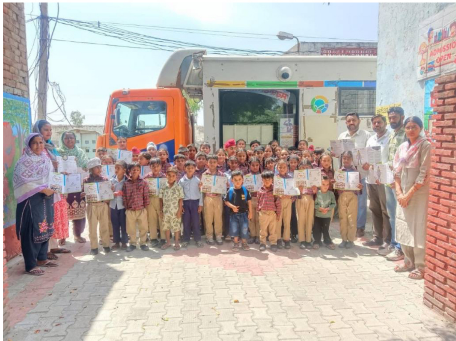
ਦੁੱਧ, ਘਿਓ ਅਤੇ ਪਨੀਰ ਦੇ 8 ਨਮੂਨੇ ਇਕੱਤਰ ਕੀਤੇ।