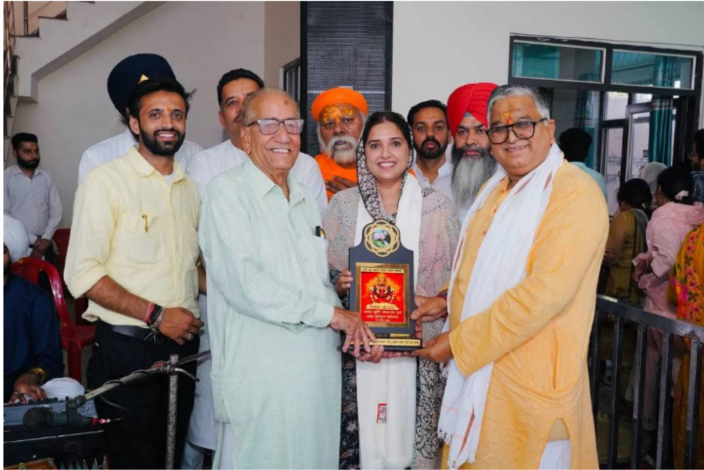
ਪੂਰਾ ਵਾਤਾਵਰਨ ਬਾਬਾ ਖਾਟੂ ਸ਼ਿਆਮ ਜੀ ਦੇ ਰੰਗ ਵਿੱਚ ਰੰਗਿਆ ਗਿਆ |