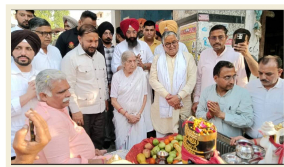
ਸ਼ਹਿਰ 'ਚ ਫੁੱਲਾਂ ਦੀ ਵਰਖਾ ਨਾਲ ਸਵਾਗਤ, ਪ੍ਰਮੁੱਖ ਸ਼ਖਸੀਅਤਾਂ ਨੇ ਲਿਆ ਆਸ਼ੀਰਵਾਦ

ਗੁਰਪ੍ਰੀਤ ਸਿੰਘ ਕੱਦ ਗਿੱਲ ਤਰਨ ਤਾਰਨ, 22 ਅਪ੍ਰੈਲ ਸ੍ਰੀ ਗੋਪਾਲ ਗਊਸ਼ਾਲਾ ਅਤੇ ਅਨੁਸੰਧਾਨ ਕੇਂਦਰ, ਪੰਡੋਰੀ ਗੋਲਾ ਰੋਡ ਤਰਨ ਤਾਰਨ ਵਿਖੇ ਸ੍ਰੀ ਗਣਪਤੀ ਗਣੇਸ਼ ਜੀ, ਹਾਰੇ ਕੇ ਸਹਾਰੇ ਸ੍ਰੀ ਖਾਟੂ ਸ਼ਿਆਮ ਜੀ ਅਤੇ ਸ੍ਰੀ ਹਨੂੰਮਾਨ ਜੀ ਦੀਆਂ ਮੂਰਤੀਆਂ ਦੀ ਸਥਾਪਨਾ ਦੇ ਸਬੰਧ ਵਿੱਚ ਸ਼ਹਿਰ ਵਿੱਚ ਭਗਤੀਮਈ ਮਾਹੌਲ ਦੌਰਾਨ ਵਿਸ਼ਾਲ ਸ਼ੋਭਾ ਯਾਤਰਾ ਕੱਢੀ ਗਈ। ਸ਼ੋਭਾ ਯਾਤਰਾ ਵਿੱਚ ਵੱਡੀ ਗਿਣਤੀ ਵਿੱਚ ਸ਼ਰਧਾਲੂਆਂ, ਸਮਾਜਿਕ, ਧਾਰਮਿਕ ਅਤੇ ਰਾਜਨੀਤਿਕ ਸੰਗਠਨਾਂ ਦੇ ਨੁਮਾਇੰਦਿਆਂ ਨੇ ਸ਼ਮੂਲੀਅਤ ਕਰਕੇ ਬਾਬਾ ਖਾਟੂ ਸ਼ਿਆਮ ਜੀ ਦਾ ਆਸ਼ੀਰਵਾਦ ਪ੍ਰਾਪਤ ਕੀਤਾ। ਫੋਲ-ਨਗਾਰਿਆਂ ਅਤੇ ਜੈਕਾਰਿਆਂ ਦੀ ਗੂੰਜ ਵਿੱਚ ਸ੍ਰੀ ਗਣਪਤੀ ਗਣੇਸ਼ ਜੀ, ਸ੍ਰੀ ਖਾਟੂ ਸ਼ਿਆਮ ਜੀ ਅਤੇ ਸ੍ਰੀ ਹਨੂੰਮਾਨ ਜੀ ਦੀਆਂ ਮੂਰਤੀਆਂ ਨੂੰ ਸੁੰਦਰ ਸਜਾਈ ਹੋਈ ਸਵਾਰੀ ਵਿੱਚ ਬਿਰਾਜਮਾਨ ਕਰਕੇ ਸ਼ੋਭਾ ਯਾਤਰਾ ਸ੍ਰੀ ਗੋਪਾਲ ਗਊਸ਼ਾਲਾ ਤੋਂ ਸ਼ੁਰੂ ਹੋਈ। ਇਹ ਯਾਤਰਾ ਸ਼ਹਿਰ ਦੇ ਮੁੱਖ ਬਾਜ਼ਾਰਾਂ ਅਤੇ ਰਸਤਿਆਂ ਤੋਂ ਗੁਜ਼ਰਦੀ ਹੋਈ ਪਹਿਲਾਂ ਸ੍ਰੀ ਠਾਕੁਰ ਦਵਾਰਾ ਮਦਨ ਮੇਹਨ ਮੰਦਰ ਪਹੁੰਚੀ, ਜਿੱਥੇ ਸ਼ਰਧਾਲੂਆਂ ਨੇ ਫੁੱਲਾਂ ਦੀ ਵਰਖਾ ਕਰਕੇ ਭਰਪੂਰ ਸਵਾਗਤ ਕੀਤਾ। ਇਸ ਤੋਂ ਬਾਅਦ ਯਾਤਰਾ ਸ਼ਹਿਰ ਦੇ ਵੱਖ-ਵੱਖ ਇਲਾਕਿਆਂ ਦਾ ਭ੍ਰਮਣ ਕਰਦੀ ਹੋਈ ਮੁੜ ਗਊਸ਼ਾਲਾ ਵਿਖੇ ਆ ਕੇ ਸਮਾਪਤ ਹੋਈ। ਪੂਰੇ ਰਸਤੇ ਦੌਰਾਨ ਸ਼ਹਿਰ ਵਾਸੀਆਂ ਵੱਲੋਂ ਫੁੱਲਾਂ ਦੀ ਵਰਖਾ ਕਰਕੇ ਅਤੇ ਸੇਵਾ-ਭਾਵ ਨਾਲ ਜਲ ਪਾਨ ਦੇ ਪ੍ਰਬੰਧ ਕਰਕੇ ਸ਼ੋਭਾ ਯਾਤਰਾ ਦਾ ਜੋਸ਼ੀਲਾ ਸਵਾਗਤ ਕੀਤਾ ਗਿਆ, ਜਿਸ ਨਾਲ ਸਮਾਗਮ ਦਾ ਮਾਹੌਲ ਪੂਰੀ