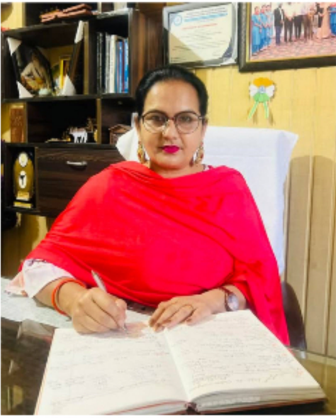
ਬੁਰੀ ਸੰਗਤ ਕੇਲੇ ਵਾਂਗ ਹੁੰਦੀ ਹੈ ਜੇ ਗਰਮ ਹੋਵੇ ਤਾਂ ਹੱਥ ਸਾੜ ਦਿੰਦਾ ਹੈ ਅਤੇ ਠੰਢਾ ਹੋਵੇ ਤਾਂ ਹੱਥ ਕਾਲੇ ਕਰ ਦਿੰਦਾ ਹੈ" ਕਹਿਣ ਦਾ ਭਾਵ ਬੁਰੀ ਸੰਗਤ ਇਨਸਾਨ ਨੂੰ ਹਰ ਤਰ੍ਹਾਂ ਨਾਲ ਨੁਕਸਾਨ ਪਹੁੰਚਾਉਂਦੀ ਹੈ, ਜਿੰਨਾ ਹੋ ਸਕੇ ਬੱਚਿਆਂ ਨੂੰ ਬੁਰੀ ਸੰਗਤ ਤੋਂ ਬੱਚਣਾ ਚਾਹੀਦਾ ਹੈ ਅਤੇ ਮਾਪਿਆਂ ਦਾ ਫਰਜ਼ ਵੀ ਬਣਦਾ ਹੈ ਕਿ

ਇਸ ਗੱਲ ਦਾ ਖਾਸ ਧਿਆਨ ਰੱਖਣ ਕਿ ਸਾਡਾ ਬੱਚਾ ਕਿਸਦੇ ਨਾਲ ਮਿਲਦਾ ਹੈ, ਕਿਸ ਦੇ ਨਾਲ ਬਾਹਰ ਘੁੰਮਦਾ ਫਿਰਦਾ ਹੈ, ਉਸਦੀ ਦੇਸਤੀ ਕਿੰਨਾਂ ਬੱਚਿਆਂ ਨਾਲ ਹੈ। ਪੜ੍ਹਨ ਵਾਲੇ ਅਤੇ ਮਾਤਾ ਪਿਤਾ ਦੇ ਆਗਿਆਕਾਰ ਬੱਚੇ ਬਹੁਤੀ ਅਵਾਰਾਗਰਦੀ ਨਹੀਂ ਕਰਦੇ ਫਿਰਦੇ ਅਤੇ ਇਹੋ ਜਿਹੇ ਬੱਚੇ ਆਪਣੇ ਦੇਸਤਾਂ ਨੂੰ ਵੀ ਆਪਣੇ ਵਰਗਾ ਬਣਨ ਲਈ ਪ੍ਰੇਰਿਤ ਕਰਦੇ ਹਨ ਅਤੇ ਇਸਤੋਂ ਉਲਟ ਜਿਹੜੇ ਬੱਚੇ ਆਪ ਗਲਤੀਆਂ ਕਰਦੇ ਹਨ ਪੜ੍ਹਨ ਤੋਂ ਮਨ ਚੁਰਾਉਂਦੇ ਹਨ ,ਮਾਪਿਆਂ ਨਾਲ ਝੂਠ ਬੋਲਦੇ ਹਨ ,ਸਕੂਲ ਤੋਂ ਗੈਰਹਾਜ਼ਰ ਰਹਿੰਦੇ ਹਨ ਉਹ ਆਪਣੇ ਦੇਸਤਾਂ ਨੂੰ ਕਿਵੇਂ ਚੰਗੀ ਸਲਾਹ ਦੇਣਗੇ ,ਓਹ ਆਪਣੀ ਸੰਗਤ ਵਿੱਚ ਆਉਣ ਵਾਲਿਆਂ ਨੂੰ ਗਲਤ ਦਿਸ਼ਾ ਦਿੰਦੇ ਹਨ ਅਤੇ ਉਹਨਾਂ ਨੂੰ ਵੀ ਕੰਮਚੋਰ ,ਨਿਕੰਮਾ ,ਵੇਹਲੜ ਅਤੇ ਮਾਪਿਆਂ ਤੋਂ ਬੇਮੁੱਖ ਬਣਾ ਦਿੰਦੇ ਹਨ, ਉਹਨਾਂ ਦੀ ਸੰਗਤ ਵਿੱਚ ਆਕੇ ਇੱਕ ਭੋਲਾ ਭਾਲਾ ਸ਼ਰੀਫ਼ ਬੱਚਾ ਵੀ ਗਲਤੀ ਕਰ ਬੈਠਦਾ ਹੈ। ਮੈਂ ਇਸੇ ਤਰ੍ਹਾਂ ਦੀ