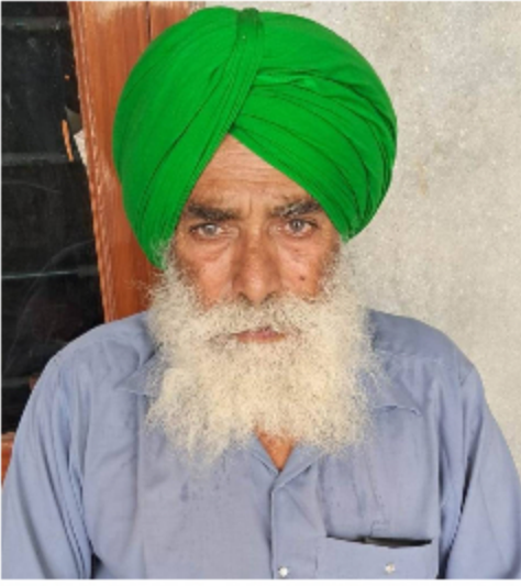
ਗਦਾਰ ਰਾਜ ਸਭਾ ਦੀਆਂ ਸੀਟਾਂ ਮੁੱਲ ਵੇਚੀਆ, ਇਕੱਠੇ ਕੀਤੇ ਸੈਂਕੜੇ ਲੱਖ ਹਜ਼ਾਰ ਜੀ।