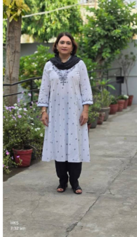
ਅੰਤਾਂ ਦਾ ਮੰਗ, ਬੇੜੀ ਦੇਰ ਲਈ ਪਰ ਹੱਡੀਆਂ

ਠਾਰਦੀ ਠੰਡ ਸਭ ਸਾਡੀ ਨਾ ਸੁਕਰੀਆ ਕਰਕੇ ਹੈ। ਅਸੀਂ ਅਕਿਰਤਘਣ ਲੋਕ ਹਾਂ। ਅਸੀਂ ਕੁਦਰਤ ਨੂੰ ਆਪਣੇ ਹਿਸਾਬ ਨਾਲ ਚਲਾਉਣਾ ਚਾਹੁੰਦੇ ਹਾਂ। ਬਸ ਇੱਥੇ ਹੀ ਮਾਰ ਖਾ ਜਾਂਦੇ ਹਾਂ। ਧਰਤੀ ਦਾ ਸਾਰਾ ਰੰਗ ਰੂਪ ਅਸੀਂ ਬਦਲਿਆ ਹੈ। ਉਸਦੇ ਘਣੇ ਜੰਗਲ ਅਸੀਂ ਉਜਾੜ ਦਿੱਤੇ ਹਨ ਤੇ ਵਸਾ ਲਈਆਂ ਹਨ ਕਨਕਰੀਟ ਦੀਆਂ ਬਸਤੀਆਂ। ਅਸੀਂ ਖੋਹ ਲਏ ਨੇ ਘਰ ਜੰਗਲੀ ਜੀਵਾਂ ਦੇ। ਅਸੀਂ ਸ਼ਹਿਰਾਂ ਵਿੱਚ ਕਿਤੇ ਘਾਹ ਨਹੀਂ ਛੱਡਿਆ ਇੰਟਰਲੋਕ ਟਾਈਲਾਂ ਲਵਾ ਦਿੱਤੀਆਂ ਹਨ। ਅਸੀਂ ਸਫਾਈ ਪਸੰਦ ਲੋਕ ਹਾਂ। ਸਾਨੂੰ ਘਰ ਵਿੱਚ ਛਿਪਕਲੀ ਚੰਗੀ ਨਹੀਂ ਲੱਗਦੀ। ਛਿਪਕਲੀ ਜੇ ਮੱਛਰ ਖਾ ਜਾਂਦੀ ਹੈ ਉਸਨੂੰ ਕੱਢ ਕੇ ਅਸੀਂ ਮੱਛਰ ਮਾਰਨ ਲਈ ਸਪਰੇਅ ਕਰਦੇ ਹਾਂ। ਇਹ ਵੱਖਰੀ ਗੱਲ ਹੈ ਕਿ ਉਹ ਸਪਰੇਅ ਸਾਡੇ ਫੇਫੜਿਆਂ ਤੱਕ ਜਾਂਦੀ ਹੈ ਤੇ ਸਾਨੂੰ ਨੁਕਸਾਨ ਪਹੁੰਚਾਉਂਦੀ ਹੈ। ਅਸੀਂ ਕੁਦਰਤ ਦੇ ਨਿਯਮ ਨੂੰ ਤੋੜ ਕੇ ਆਪਣੇ ਦਿਮਾਗ ਨਾਲ ਬਣਾਈਆਂ ਚੀਜ਼ਾਂ ਉਸ ਵਿੱਚ ਫਿੱਟ ਕਰਨਾ ਚਾਹੁੰਦੇ ਹਾਂ। ਕੁਦਰਤ ਨੇ ਜਵਾਬ ਤਾਂ ਦੇਣਾ ਹੀ ਹੈ। ਉਸ ਜਵਾਬ ਨੂੰ ਅਸੀਂ ਸਮਝਦੇ ਨਹੀਂ ਕੁਦਰਤ ਦੀ ਕਰੋਪੀ ਕਹਿੰਦੇ ਹਾਂ। ਜੇਕਰ ਤੁਸੀਂ ਕਿਸੇ ਦਾ ਘਰ ਬਰਬਾਦ ਕਰੋਗੇ ਤਾਂ ਕਰੋਪੀ ਤਾਂ ਉਹ ਵਿਖਾਏਗਾ ਹੀ। ਜਦੋਂ ਤੁਹਾਨੂੰ ਤੁਹਾਡੇ ਇਹਨਾਂ ਇਲੈਕਟਰੋਨਿਕ ਯੰਤਰਾਂ ਵਿੱਚੋਂ ਕਿਤੇ ਫੁਰਸਤ ਮਿਲੀ ਤਾਂ ਬੈਠ ਕੇ ਸੋਚੋ ਕਿ ਇਹ ਕੀੜੀਆਂ ਮੱਖੀਆਂ ਚੂਹੀਆਂ ਇਹ ਸਭ ਨੂੰ ਅਸੀਂ ਖਤਮ ਕਰ ਰਹੇ ਹਾਂ। ਨਸਲ ਕੁਸ਼ੀ ਹੈ ਇਹ। ਕੁਦਰਤ ਦੇ ਹਰ ਸਿਧਾਂਤ ਨੂੰ ਤੋੜ ਰਹੇ ਹਾਂ। ਸਾਫ ਸਫਾਈ ਰੱਖਣ ਲਈ ਘਰ ਵਿੱਚ ਦਰਖਤ ਨਹੀਂ ਲਾਉਂਦੇ ਗਮਲਿਆਂ ਵਿੱਚ ਛੋਟੇ ਛੋਟੇ ਫੁੱਲ ਲਾਉਂਦੇ ਹਾਂ। ਦਰਖਤ ਬੂਟੇ ਲੱਗਦੇ ਹਨ ਕਿਉਂਕਿ ਪੱਤੇ ਡਿਗਦੇ ਹਨ ਤੇ