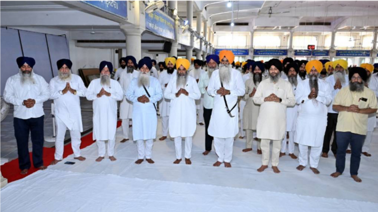
ਅੰਮ੍ਰਿਤਸਰ, 5 ਮਈ - |