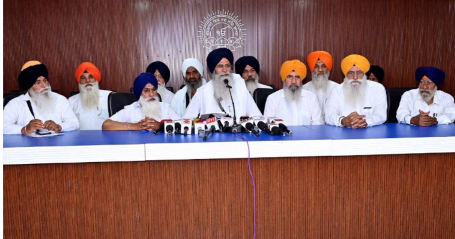
ਸ਼ਤਾਬਦੀ ਸਬੰਧੀ ਸਮਾਗਮਾਂ ਦੀ ਰੂਪ ਰੇਖਾ ਉਲੀਕਣ ਲਈ ਸਬ-ਕਮੇਟੀ ਦੀ ਹੋਈ ਇਕੱਤਰਤਾ |