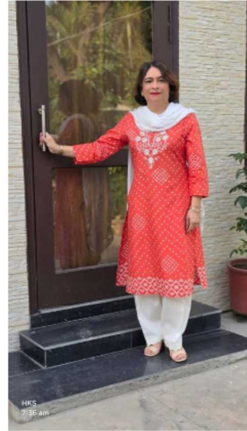
ਸੰਪੂਰਨ ਕੋਈ ਨਹੀਂ ਹੁੰਦਾ। ਹਰ ਮਨੁੱਖ ਵਿੱਚ ਕੁਝ ਨਾ ਕੁਝ ਕਮੀ ਹੁੰਦੀ ਹੈ। ਲੋਕਾਂ ਵਿੱਚ

ਸੰਪੂਰਨਤਾ ਦੀ ਤਲਾਸ਼ ਨਾ ਕਰੋ। ਹੱਥ ਉਸ ਨਹੀਂ ਲੱਗਣਾ। ਸਿਰਫ਼ ਦੋ ਤਰ੍ਹਾਂ ਦੇ ਲੋਕ ਸੰਪੂਰਨ ਹੁੰਦੇ ਹਨ ਜਾਂ ਤਾਂ ਅਣਜੰਮੇ ਜਾਂ ਫਿਰ ਮਰੇ ਹੋਏ। ਕਈ ਵਾਰ ਕਿਸੇ ਅਣਜਾਣ ਆਦਮੀ ਦੇ ਭੋਗ ਤੇ ਜਾਉ ਤਾਂ ਇੰਜ ਜਾਪਦਾ ਹੈ ਮੈਂ ਇਸ ਨੂੰ ਜਿਉਂਦੇ ਜੀ ਕਿਉਂ ਨਹੀਂ ਮਿਲਿਆ। ਉਸ ਦੀਆਂ ਸਿਫ਼ਤਾਂ ਦੇ ਪੁਲ ਬੰਨ੍ਹ ਜਾ ਰਹੇ ਹੁੰਦੇ ਹਨ। ਪਰ ਸਭ ਦਿਖਾਵੇ ਲਈ ਹੁੰਦਾ ਹੈ। ਅਸਲ ਵਿੱਚ ਕੋਈ ਵੀ ਮਨੁੱਖ ਸੰਪੂਰਨ ਨਹੀਂ ਹੁੰਦਾ। ਹਰ ਮਨੁੱਖ ਵਿੱਚ ਕਮੀਆਂ ਹੁੰਦੀਆਂ ਹਨ। ਮਨੁੱਖ ਕਦੀ ਵੀ ਸਾਰਿਆਂ ਨੂੰ ਖੁਸ਼ ਕਰ ਸਕਦਾ। ਜਿਉਂਦਾ ਮਨੁੱਖ ਅਨੇਕਾਂ ਪ੍ਰਕਾਰ ਦੀਆਂ ਵਿਅਕਤੀਗਤ ਸਮੱਸਿਆਵਾਂ ਨਾਲ ਜੁੜਦਾ ਹੈ। ਉਹ ਹਮੇਸ਼ਾਂ ਖੁਸ਼ ਨਹੀਂ ਹੁੰਦਾ ਕਿ ਦੂਜਿਆਂ ਨੂੰ ਖੁਸ਼ ਰੱਖ ਸਕੇ। ਉਸ ਦੀਆਂ ਪ੍ਰੇਸ਼ਾਨੀਆਂ ਉਸਦੇ ਵਿਵਹਾਰ ਵਿਚ ਬਦਲਾਅ ਲਿਆਉਂਦੀਆਂ ਹਨ। ਗੁੱਸੇ ਤੇ ਉਤੇਜਨਾ ਦੇ ਕਾਰਨ ਕਈ ਵਾਰ ਉਹ ਜ਼ਿਆਦਤੀਆਂ ਕਰ ਬੈਠਦਾ ਹੈ। ਉਸ ਤੋਂ ਉਮੀਦ ਰੱਖਣ ਵਾਲੇ ਅਨੇਕਾਂ ਲੋਕ ਹੁੰਦੇ