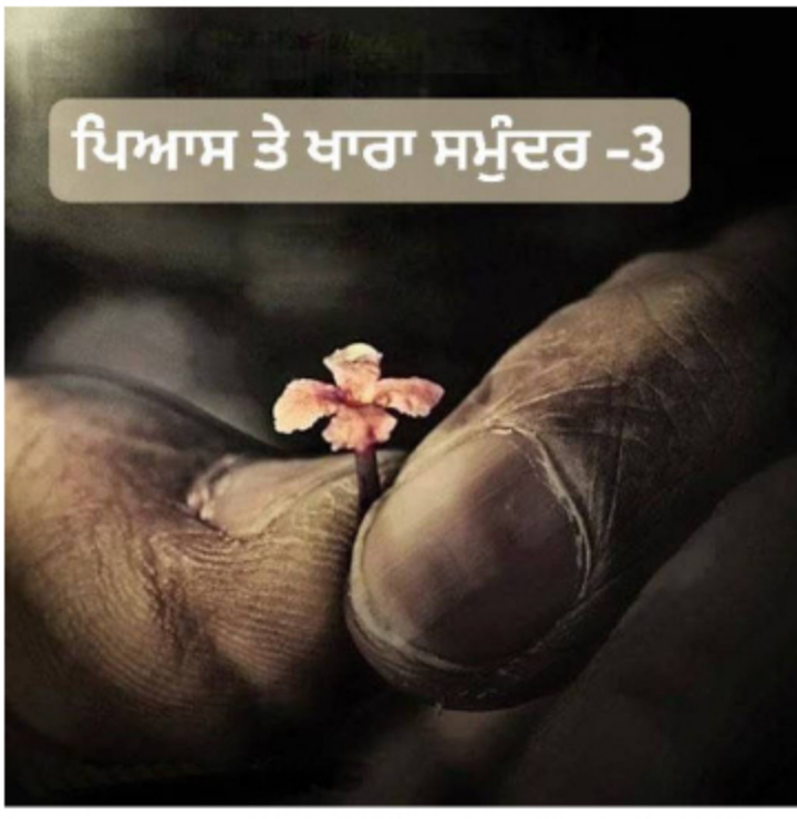
ਪਿਆਸ ਤੇ ਖਾਰਾ ਸਮੁੰਦਰ -3

"ਨਿਯਮ 3: ਹਰ ਔਰਤ ਇੱਕ ਵੇਲੂਓ ਚਾਹੁੰਦੀ ਹੈ। ਉਸਦੀ ਨੇੜਤਾ ਵਿੱਚ ਰਹਿ ਕੇ ਇਹ ਲੱਭੀ ਜਾ ਸਕਦੀ ਹੈ। ਉਸਦੀ ਭਟਕਦੀ ਹੋਈ ਨੂੰ ਠਹਿਰਾ ਕੇ, ਉਸ ਨੂੰ ਛੋਹ ਨਾਲ ਉਘੇੜਕੇ ਉਸ ਨੂੰ ਭਰੋਸੇ ਨਾਲ ਜਿੱਤ ਕੇ ਇਹਨੂੰ ਭਰੀ ਜਾ ਸਕਦੀ ਹੈ ਤੇ ਜਦ ਉਹ ਆਪਣੇ ਆਪ ਨੂੰ ਸੌਂਪ ਦੇਵੇ, ਤਦ ਉਸ ਕੋਲੋਂ ਇਸ ਮਿਹਨਤ ਦਾ ਵਿਆਜ ਵਸੂਲਕੇ ਅੱਗੇ ਵਧਿਆ ਜਾਣਾ ਚਾਹੀਦਾ ਹੈ। ਵਿਕਰਮ ਨੇ ਆਪਣੀ ਜੇਬ ਟਟੋਲੀ। ਉੱਥੇ ਉਹ ਭੂਰਾ ਲਿਫ਼ਾਫ਼ਾ ਸੀ — ਜਿਹੜਾ ਅਜੇ ਖਾਲੀ ਸੀ। ਅਮਨ ਉਸਨੂੰ ਖੁਦ ਨੂੰ ਸੌਂਪ ਚੁੱਕੀ ਸੀ ਹੁਣ ਉਸਨੇ ਇਸ ਮਿਹਨਤ ਦੀ ਇੱਕ ਕੀਮਤ ਵਸੂਲ ਕਰਨੀ ਸੀ। ਅੱਜ ਦੀ ਰਾਤ ਉਹਨੇ ਇਹੀ ਸੋਚਣਾ ਸੀ ਕਿ ਇਹ ਕੀਮਤ ਕਿੰਨੀ ਹੋਵੇਗੀ ਤੇ ਕਿਸ ਰੂਪ ਵਿੱਚ ਹੋਵੇਗੀ। ਤੇ ਫੇਰ ਆਖਰੀ, ਸਭ ਤੋਂ ਥੱਲੇ — ਉਹ ਨਿਯਮ ਜਿਹੜਾ ਉਸ ਨੇ ਆਪਣੇ ਦਿਮਾਗ ਵਿਚ ਭਰੇ ਉਸ ਸਭ ਤੋਂ ਨਫ਼ਰਤੀ ਚਿਹਰੇ ਨੂੰ ਯਾਦ ਕਰਕੇ ਲਿਖਿਆ ਸੀ।