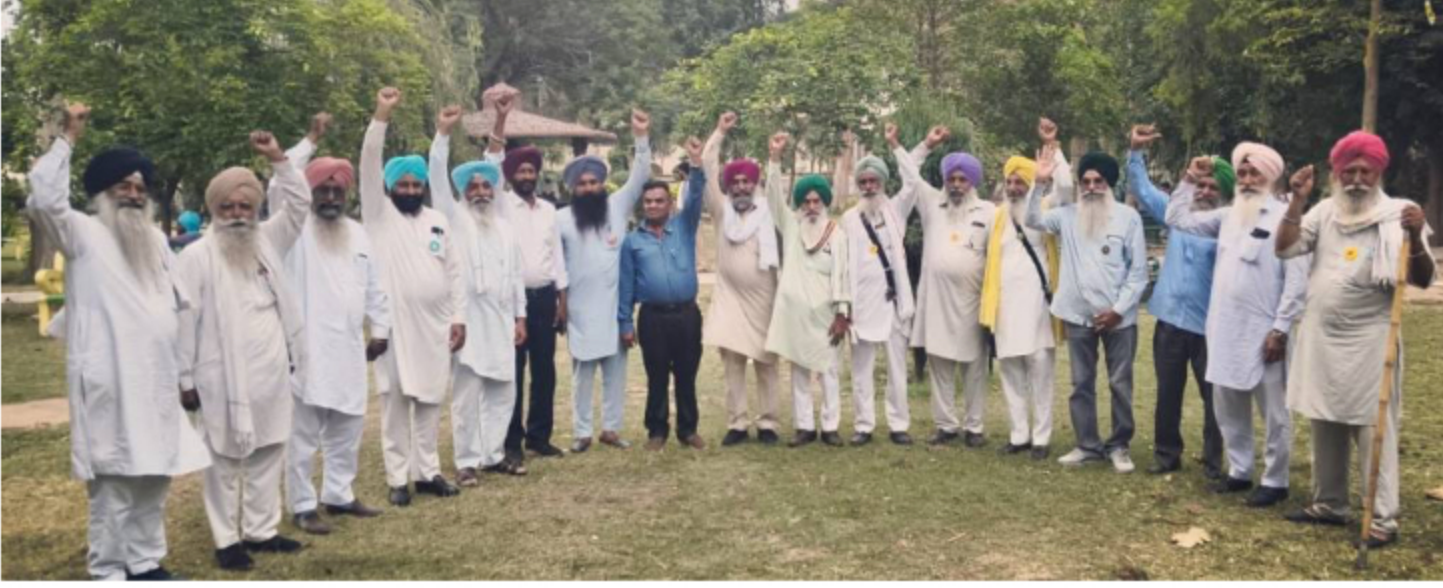
ਕਿਸਾਨਾਂ ਦੀ ਜਾਇਦਾਦ ਕਿਸੇ ਵੀ ਕੀਮਤ 'ਤੇ ਨਹੀਂ ਵਿਕਣ ਦਿਆਂਗੇ' — ਕਿਸਾਨ ਆਗੂ |