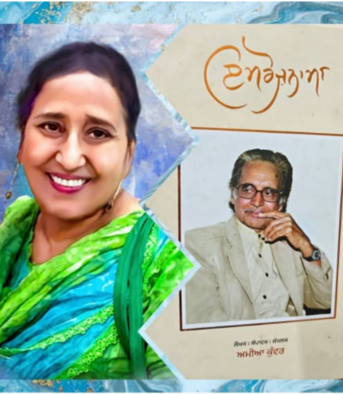
ਤੁਰ ਜਾਣ ਵਾਲਿਆਂ ਨਾਲ ਨਿਭਣਾ ਹਾਰੀ ਸਾਰੀ ਦੇ ਵੱਸ ਦਾ ਰੋਗ ਨਹੀਂ ਹੁੰਦਾ। ਇਹ ਯੁੱਗ ਚੜ੍ਹਦੇ ਸੂਰਜ ਨੂੰ ਸਲਾਮਾਂ ਕਰਨ ਦਾ ਯੁੱਗ ਹੈ