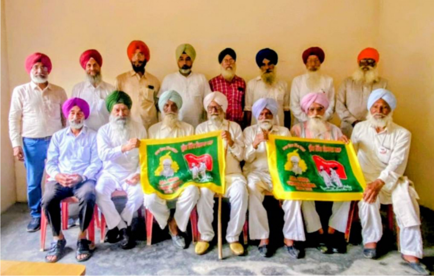
15 ਮਈ ਦੇ ਚੰਡੀਗੜ੍ਹ ਕਿਸਾਨ ਮਾਰਚ ਵਿੱਚ ਵੱਡੀ ਸ਼ਮੂਲੀਅਤ ਦਾ ਐਲਾਨ।