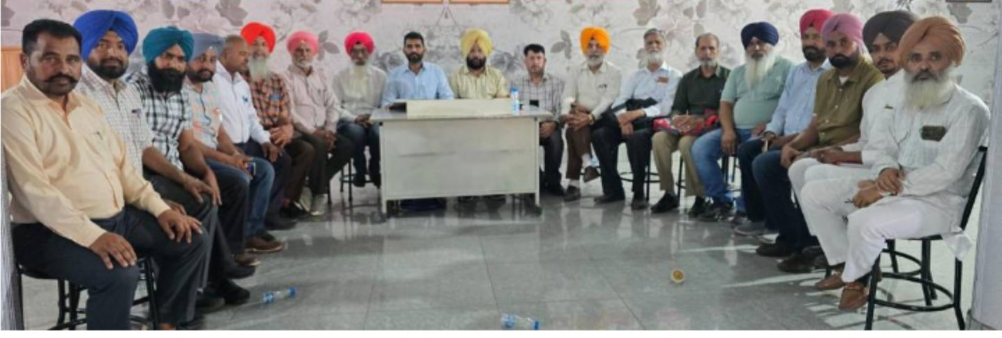
17 ਨੂੰ ਜਲੰਧਰ ਕਨਵੈਨਸ਼ਨ ਅਤੇ 19 ਮਈ ਮੁਹਾਲੀ ਰੈਲੀ ਵਿੱਚ ਵੱਡੀ ਸ਼ਮੂਲੀਅਤ ਦਾ ਸੱਦਾ |