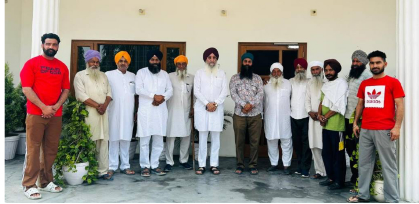
ਦਾਗੀਆਂ ਨੂੰ ਸਿਆਸੀ ਬੁੱਕਲ 'ਚ ਬਿਠਾਉਣ ਵਾਲੀਆਂ ਧਿਰਾਂ ਨੂੰ ਪੰਜਾਬ ਕਦੇ ਮੁਆਫ਼ ਨਹੀਂ ਕਰੇਗਾ - ਬ੍ਰਹਮਪੁਰਾ ।